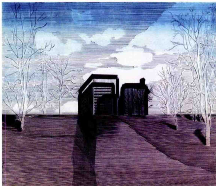
Frédéric Poincelet, Sans titre , 2016, stylo à bille et encre de couleur sur papier, 32,5 x 50 cm. Ci-dessous, Viktor Pivovarov, A mirror , 2014, aquarelle et charbon sur papier, 32,7 x 24,7 cm.